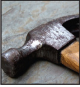
Çekiç / Zımba & Pense