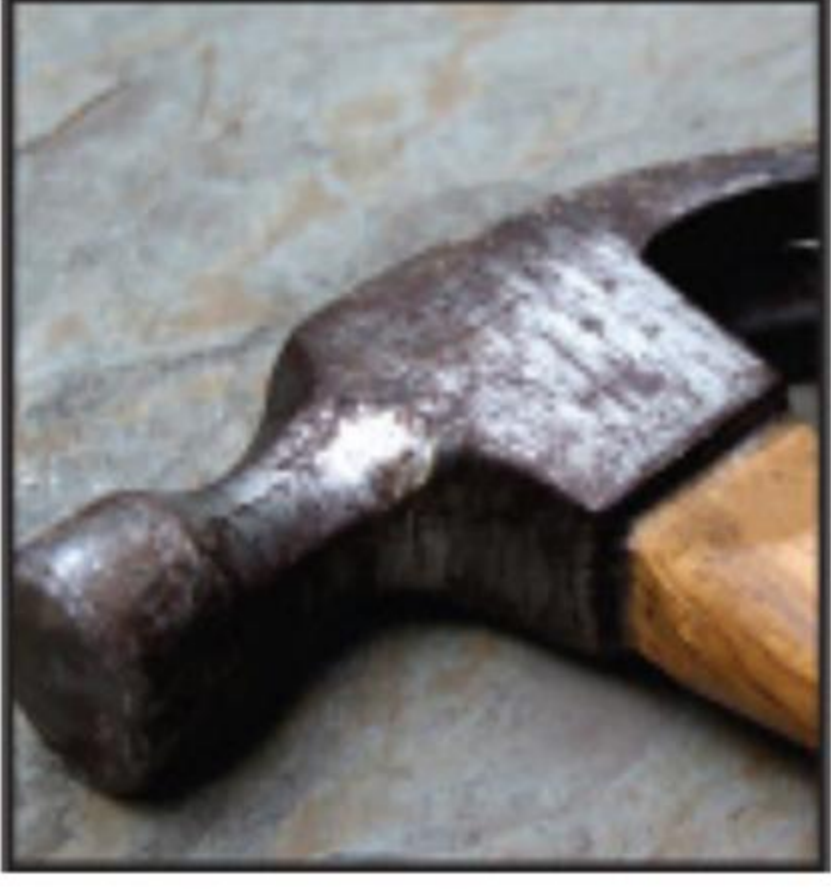
Çekiç / Zımba & Pense