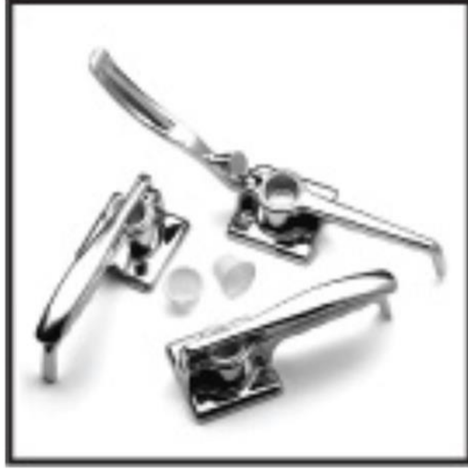
Orjinal İlaç Ezici