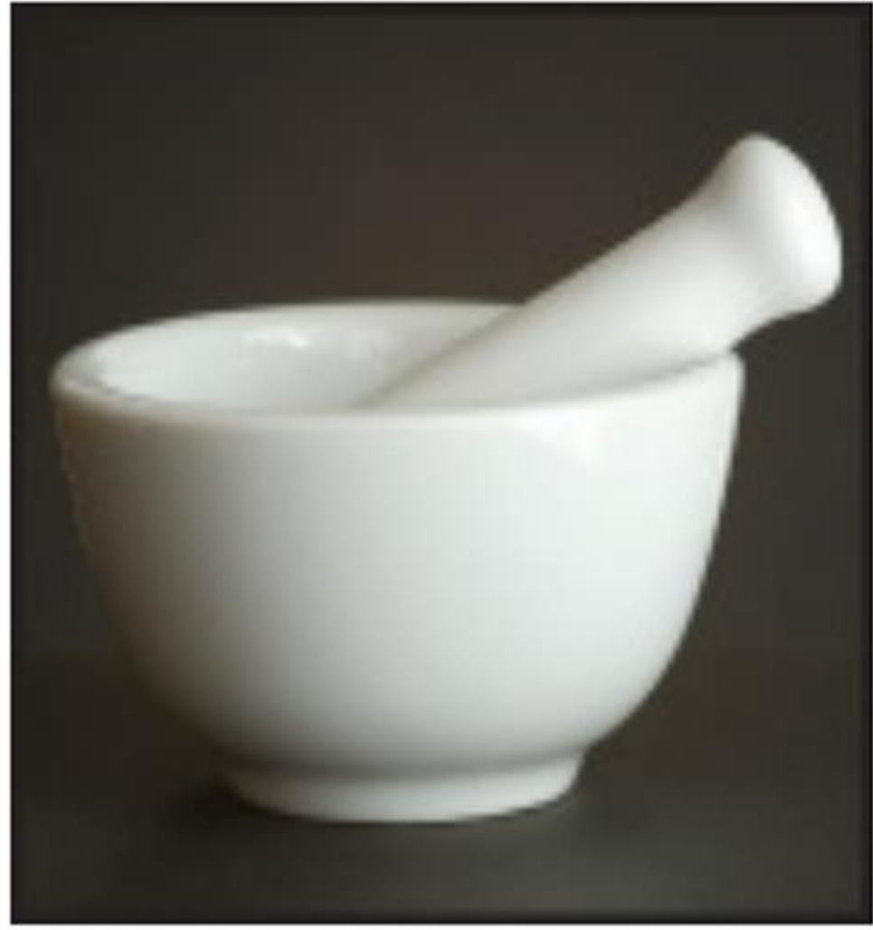
Mortar & Pestle